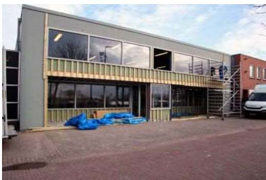
(Tekst en foto 's: Jan van der Veen)

Momenteel is er boven nog uitzicht op de Ecolution van wijlen Wubbo Ockels.