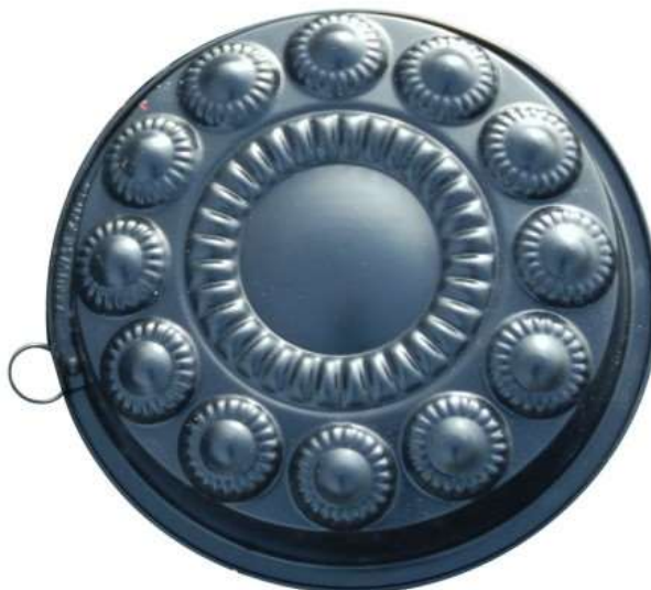
Bakvorm Zeeuwse knop

Probeer het uit en voeg naar eigen smaak toe!