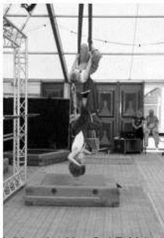
Acrobatiek van Jeugd circus Santall pinkstaren 2008