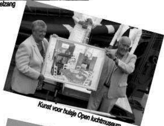
Kunst voor huisje Open luchtmuseum