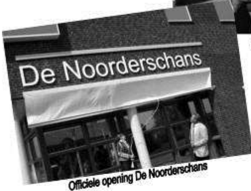
Officiële opening De Noorderschans