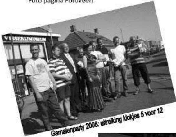
Gemalenparty 2008: uitreiking kookjes 5 voor 12