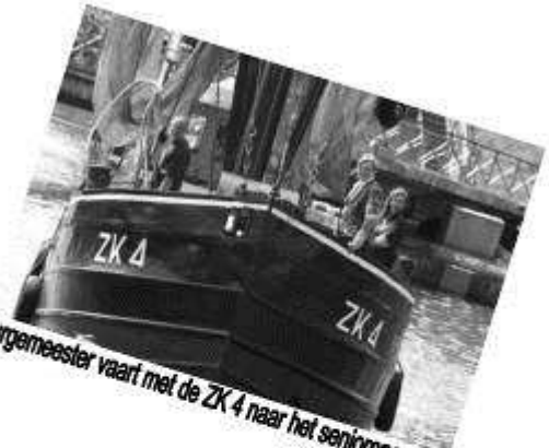
Burgemeester vaart met de ZK 4 naar het seniorencomplex