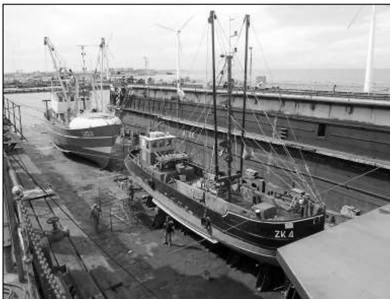
De ZK 4 in het dok van Dries Bouma op Lauwersoog.

Zaterdag 2 oktober klusdag voor het Visserijmuseum. Als u zin heeft om mee te helpen ons museum een kleine opknapbeurt te geven, kom dan gerust langs. Voor meer info kunt u bellen met Dirk Lukkien (401913) of Sjoerd Moes (402257).