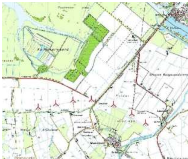
Afbeelding 2: Ligging windturbinepark WCK

Minimaal 7, maximaal 9 windturbines. As-hoogte minimaal 78, maximaal 98 meter, rotordiameter minimaal 100, maximaal 130 meter. Totale hoogte dus minimaal 128 meter, maximaal 163 meter.