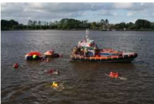
Foto's en tekst:

Na eerst op 2 zaterdagen theorie te hebben gehad, werd op zaterdag 22 september een praktijktraining van de cursus BHV voor vissers uit Groningen en Friesland gehouden. Hierbij werd assistentie verleend door de Zoutkamper brandweer, de reddingboot van Lauwersoog en rederij de Rousant. Er werd geoefend met brand op een kotter waarna de cursisten met een overlevingspak aan in het water sprongen en er vervolgens weer uitgetakeld werden of zelf op ronddrijvende dinghy's trachten te klimmen. De oefening duurde van 's morgens 9.00 uur tot 's middags 17.00 uur, waarbij ook nog even een paar visjes werden gebakken.