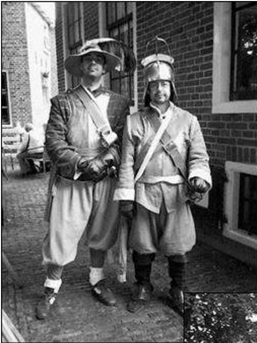
Foto impressie kleding Slag om Zoutkamp